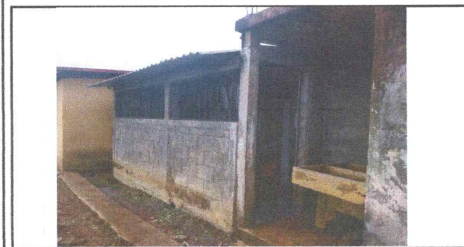
Foto 5: Se observa modulo de baño de niñas, pared expuesta a la humedad