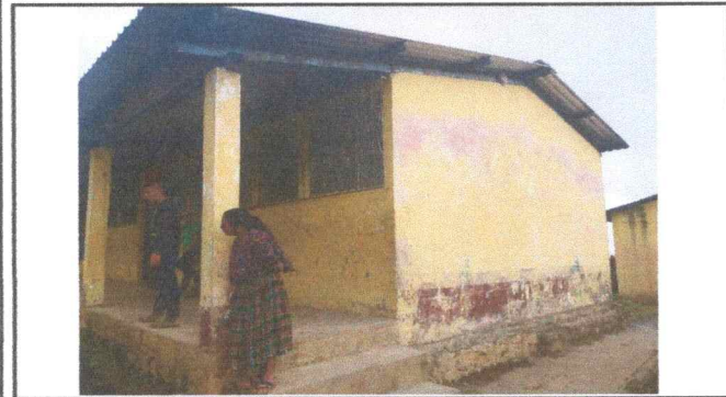
Foto 1: Se observa el deterioro de la estructura portante, desprendimiento pintura en las paredes en el modulo 2