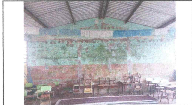
Foto 4: Se observa la presencia de humedad avanzada en pared en el modulo 3