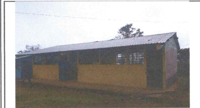
Foto 3: Se observa en area de ventanería piezas de vidrio en mal estado y/o faltante, desprendimiento de capote en modulo 3